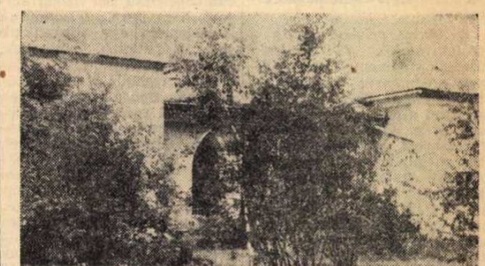
Akármerrel kerülgetem, mindenfelől fák, bokrok takarják

A kiállítást a Textiles Mű- velődési Házban Hóbe Imre, az MSZMP Pápa városi Bizottsá- gának titkára nyitotta meg.